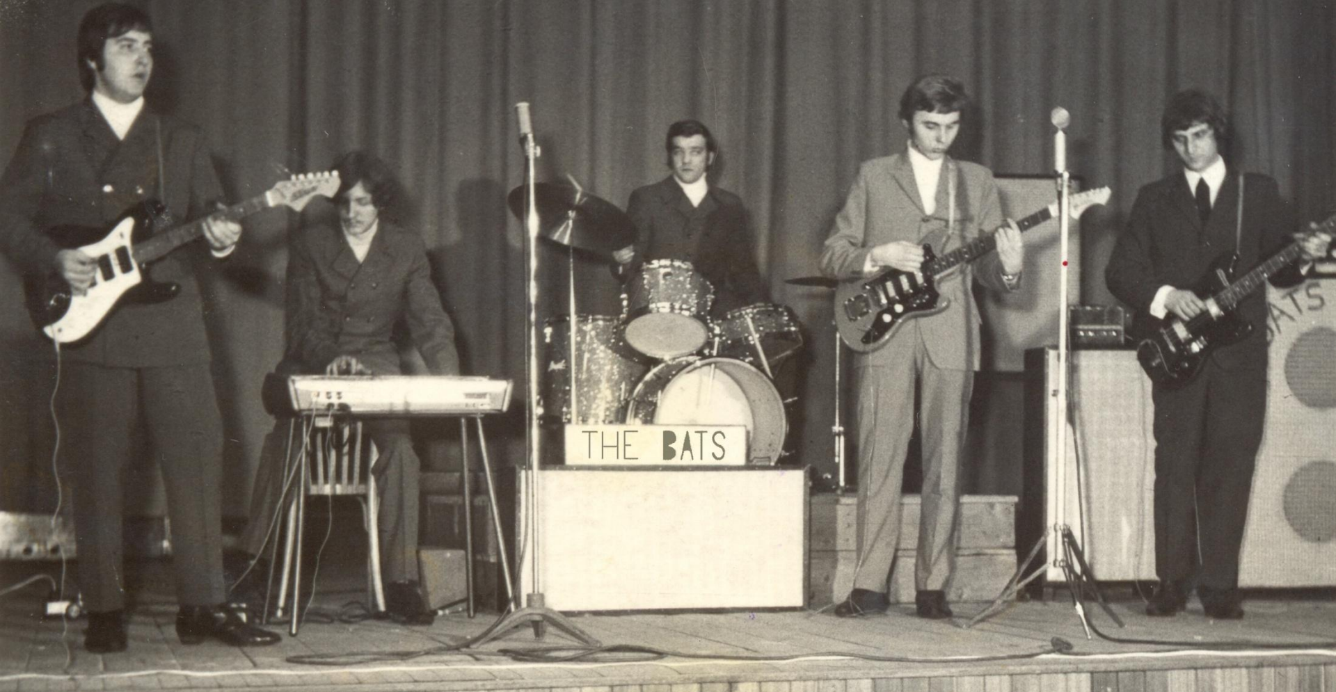
1968 – The BATS na Čaji o páté v KD Dolu AZ