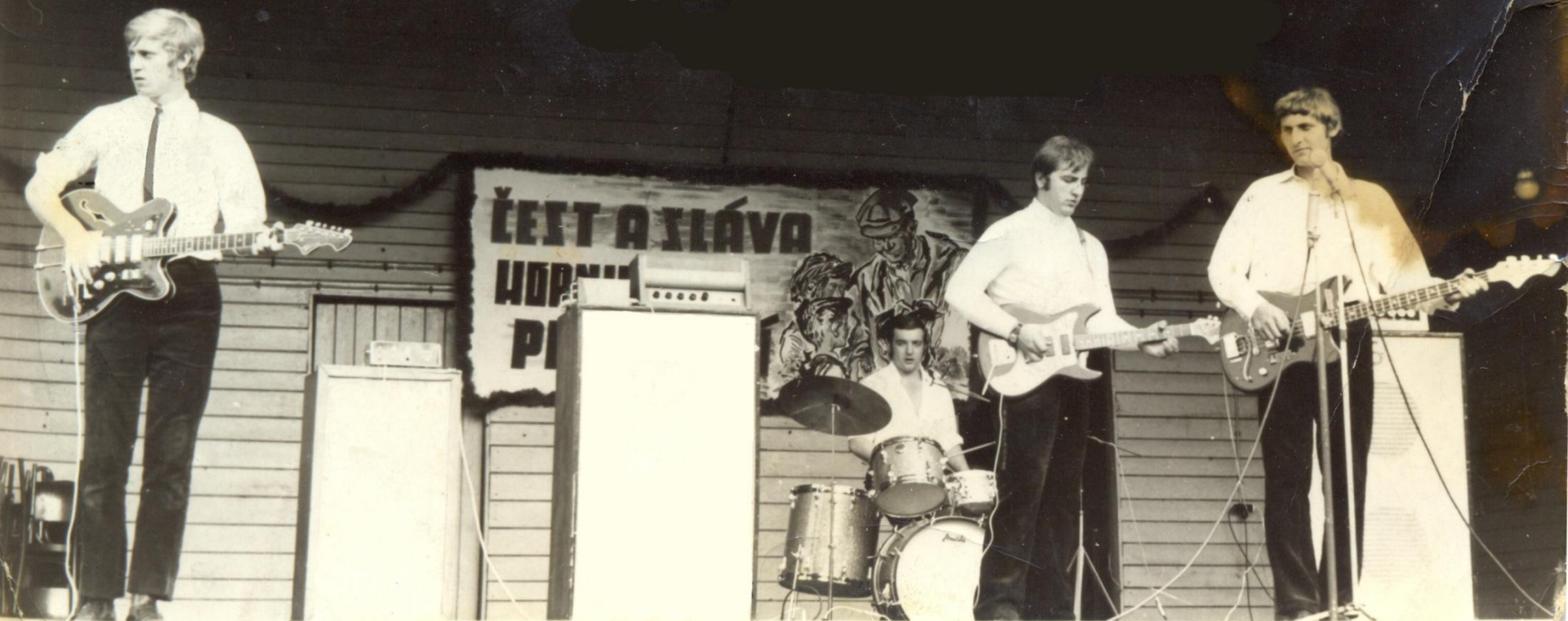
The BATS na Dni horníků v zahradě kulturáku na Evžence.